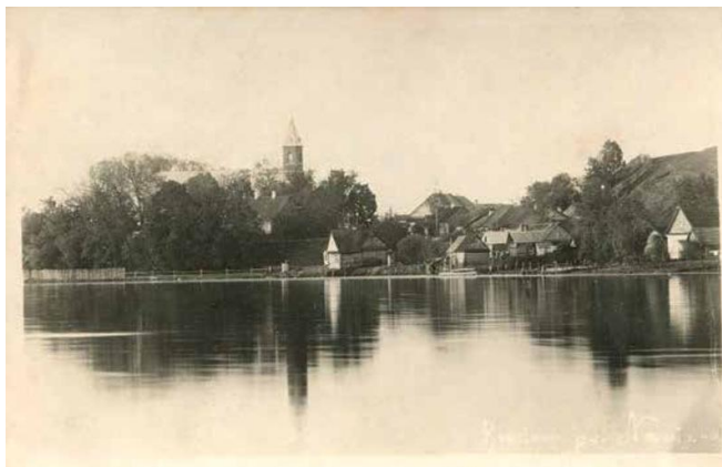
Браслаў. Від на мястэчка і касцёл. 1930-я гады.