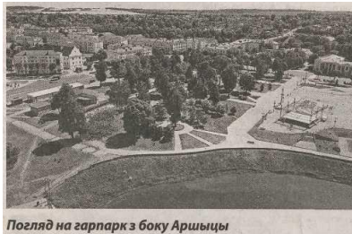
Погляд на гарпарк з боку Аршыцы