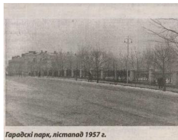
Гарадскі парк, лістапад 1957 г.