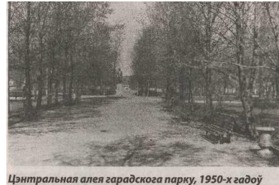
Цэнтральная аля гарадскога парку, 1950-х гадоў