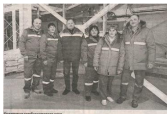
Близится комбикормовый цех

На агрокомбинате всегда с уверенностью смотрят в будущее. А достигая новых вершин, всякий раз ставят перед собой новые, амбициозные задачи. Многими производственными процессами заправляет молодежь. Работников в возрасте до 31 года на «Юбилейном» почти 25 процентов. Кому, как ни новому поколению аграриев, осваивать все современные технологии?! На этом предприятии для девушек и юношей, которые хотят работать в сельском хозяйстве, простор для самореализации и карьерного роста.