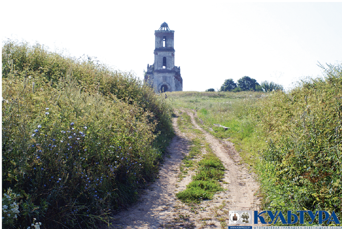
Белая царква ў Чарэі.