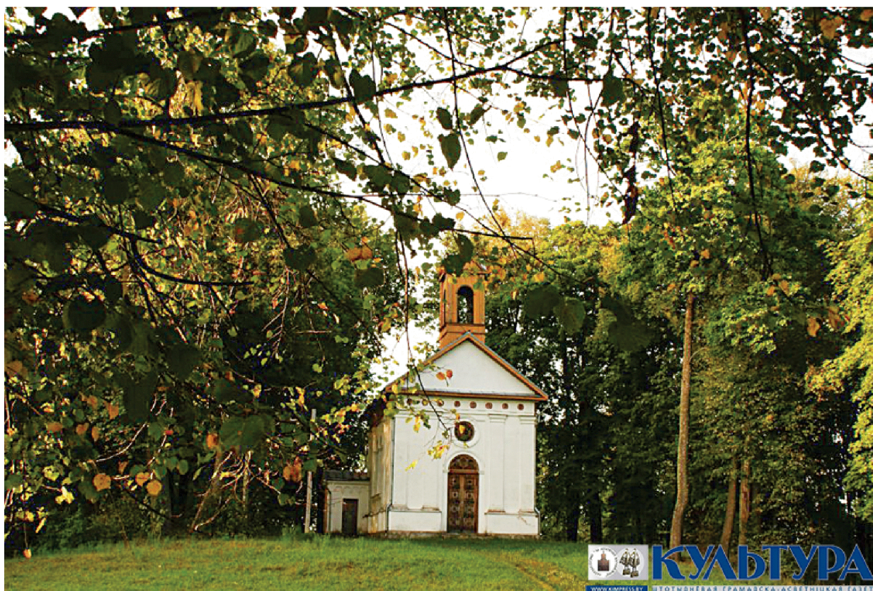
Фамільная пахавальня Мілашаў у Мілашове.

Не трэба баяцца дарог. Ты робіш крокі ў абраным кірунку, і ў хуткім часе знаходзяцца людзі, гатовыя падтрымаць. Урэшце, тое, што здавалася складаным ці нават недасяжным, станецца незабыўным падарожжам, а кропка, у якую імкнуўся дайсці, — толькі пачаткам новага шляху.