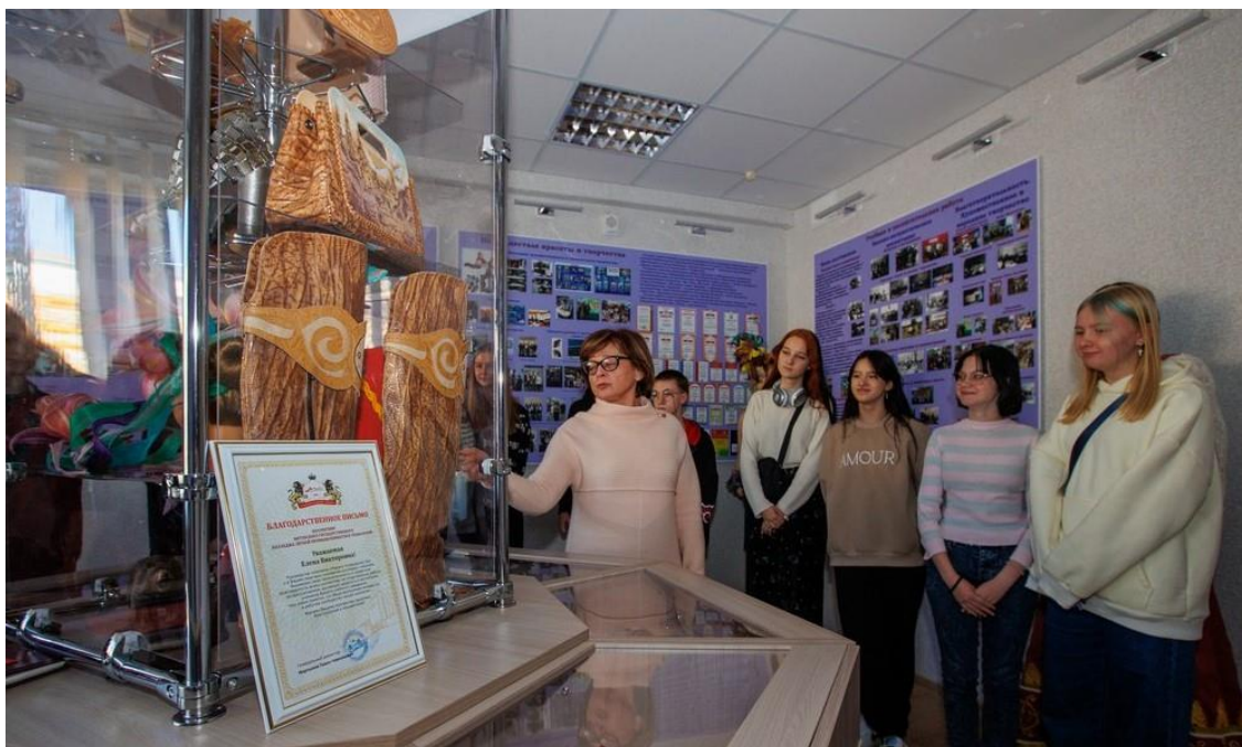
Музейная комната открыта в честь 40-летия колледжа.

История Витебского государственного колледжа легкой промышленности и технологий началась в 1983 году, когда свои двери распахнуло Витебское среднее городское училище № 160 легкой промышленности. К 40-летию учреждения образования здесь открыли музейную экспозицию. Она посвящена успехам и достижениям колледжа, людям, которые внесли большой вклад в развитие учебного заведения. Среди экспонатов много воссозданных вещей, например, первая ученическая форма, а также предметы, переданные в музей преподавателями и выпускниками разных лет.