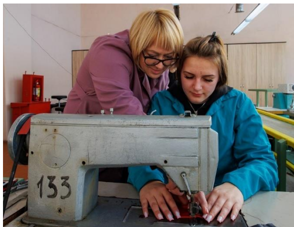
Практика под руководством опытных педагогов

Ребята принимают активное участие в областных и республиканских конкурсах. Они стремятся показать уровень своих знаний, продемонстрировать полученные навыки, открыть для себя что-то новое. В республиканском конкурсе «Капитал места» учащиеся колледжа заняли третье место. Второй год подряд ребята участвуют в республиканской выставке научно-методической литературы, педагогического опыта и творчества учащейся молодежи, показывая отличные результаты. В 2021 году колледж занял первое место за проект «Память о героях в названиях витебских улиц». В копилке профессиональных достижений учащихся есть победа в республиканском конкурсе парикмахерского искусства «Сузор'е стылю». Все его участники получили призовые места, продемонстрировав высокий уровень мастерства.