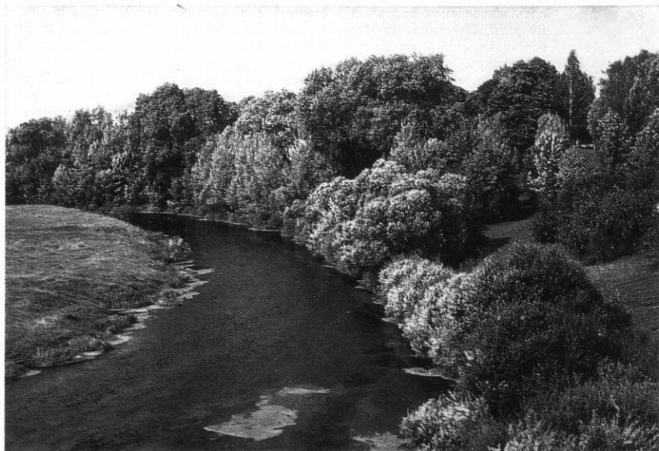
30 Излучина р. Уллы в парке Бочейково.

здесь провианта, разорила усадьбу (Цехановецкий, 1905). Практически непоправимый вред ансамблю был нанесен и во время Великой Отечественной войны 1941—1945 гг.